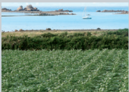
CHAMP D'ARTICHAUTS SUR LA CÔTE

L'installation du chemin de fer en 1883 contribue à développer la culture maraîchère et la ville devient le centre commercial le plus important de France