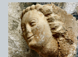
TÊTE D'ANGE CHAPELLE DU KREISKER

Plus tard le bourg monastique devient un évêché prenant le nom de Kastell Paol, du nom de son 1 er évêque Pol Aurélien, d'origine galloise. Sa légende dit qu'il serait arrivé en Bretagne, à Ouessant au VI e s., guidé par la vision d'un ange qui lui ordonna de passer