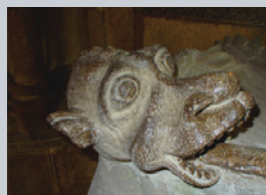
DRAGON, CATHÉDRALE POL-AURÉLIEN

Jusqu'au XVIII e s., les évêques du Léon marquent profondément l'image et l'architecture de la cité, véritable siège épiscopal comme en témoigne