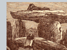
DOLMEN DE KERANGOUZ GRAVURE DU XIX e S.

Le site actuel de Saint-Pol-de-Léon fut habité dans les temps préhistoriques comme en témoigne encore