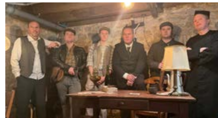
Quelques acteurs du film, réalisé par le lycée Notre-Dame du Kreisker.

En partenariat avec le SDEF, nous avons lancé un investissement de 1,6 million d'euros dans le cadre du dispositif Intracting, visant à convertir l'éclairage public en LED d'ici la fin de l'année, permettant ainsi des économies d'énergie significatives. »